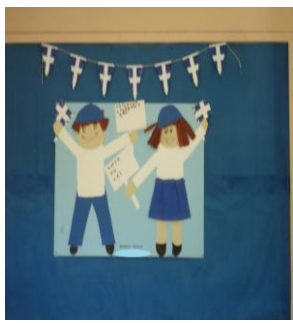
Έγραψε η μαθήτρια: Συμέλα Τσίλη

Το Όχι το θάνατο που είπες το σαράντα, εχάρισε εις τους λαούς, τη λευτεριά για πάντα